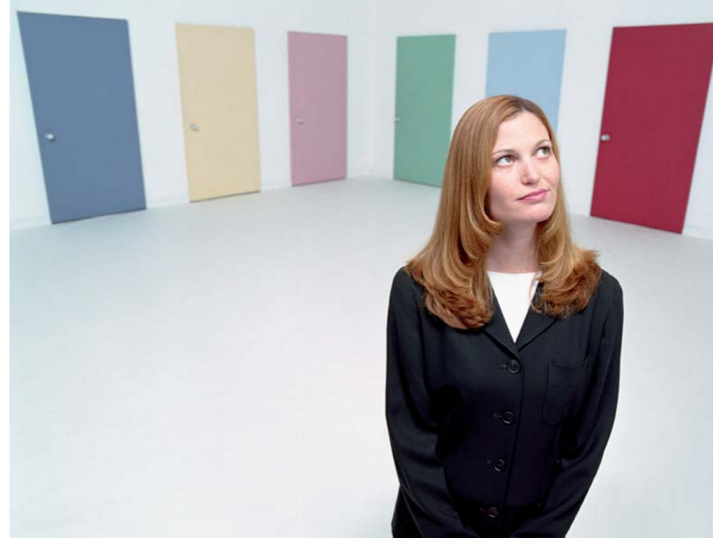
Sopra, il coaching può risultare utile in una grande varietà di casi e diverse sono le possibili specializzazioni al suo interno